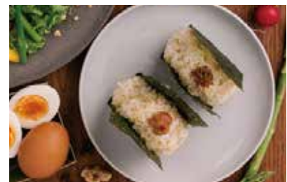
アージョのおにぎり 264 (290 税込) 具なし / のり付 具あり / のり付 (梅 or ちりめんじゃこ or 鮭) 291 (320 税込)