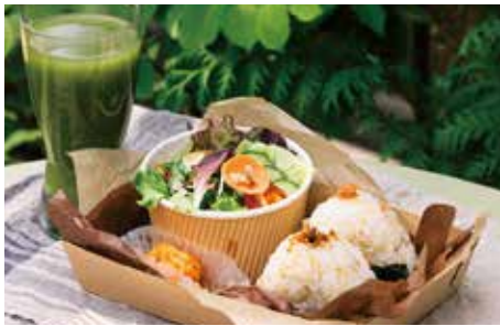
玄米のおにぎりセット 955(1,050税込) 農薬不使用の玄米おにぎり2ヶ、有機・農薬不使用こだわり野菜のサラダ、小鉢、ドリンクのセットです