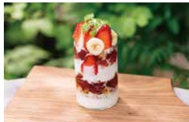
季節で変わる美肌パフェ 900 (990 税込)