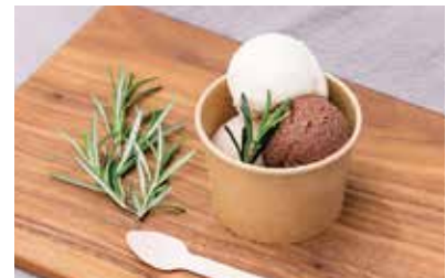
有機アイスクリーム 2個 437(480 税込) 3個 628(690 税込) バニラ / カカオ / いちごの3種よりお選びいただけます。