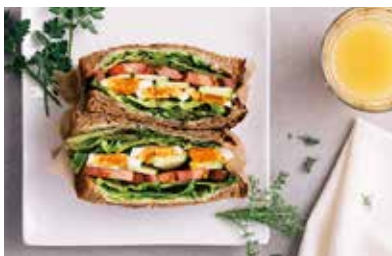
4種類から選べる特製ホットサンドセット かぼちゃホットサンド 1,255 (1,380 税込) にんじんホットサンド 美肌アボカドホットサンド 1,200 (1,320 税込) 野菜ホットサンド ※ドリンク付