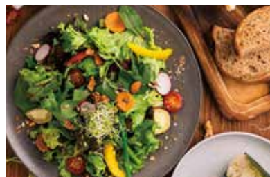
アージョ畑のサラダ 1,182 (1,300 税込) 食材 15 種使用・生ハム入り 891 食材 10 種使用 ※月の満ち欠けで変わる自家製ドレッシング付 (980 税込)