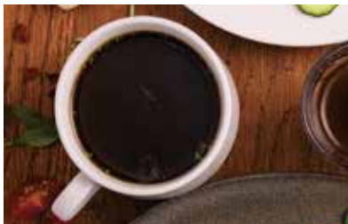
無添加八丁味噌スープ 346 (380 税込) (お得サイズ)