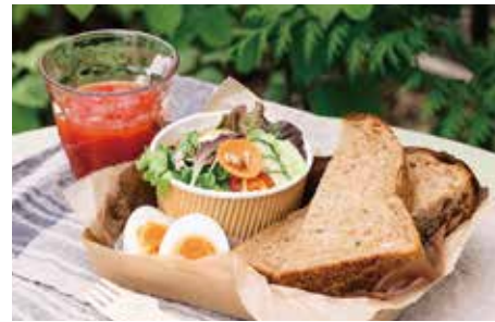
トーストセット 4枚切 746 (820 税込) 無添加雑穀パン、采女もみじゆで卵、有機・農薬不使用こだわり野菜のミニサラダ、ドリンクのセットです